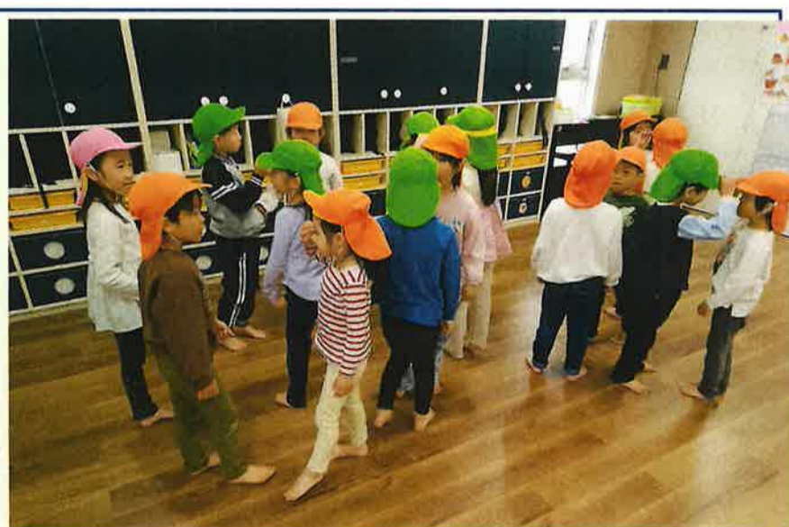
今までのゲームの中で盛り上がった カラー帽子ゲーム、今回も盛り上がりが見られていました。