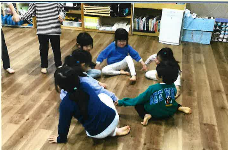
「Fiveいるよ！」 「あれ?一人足りない！」