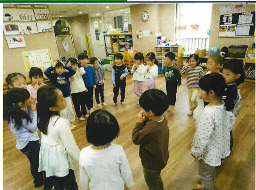
今まで歌ってきた歌を、円になって楽しく歌いました。 友達と手を繋いだりしながら、楽しく歌いました。