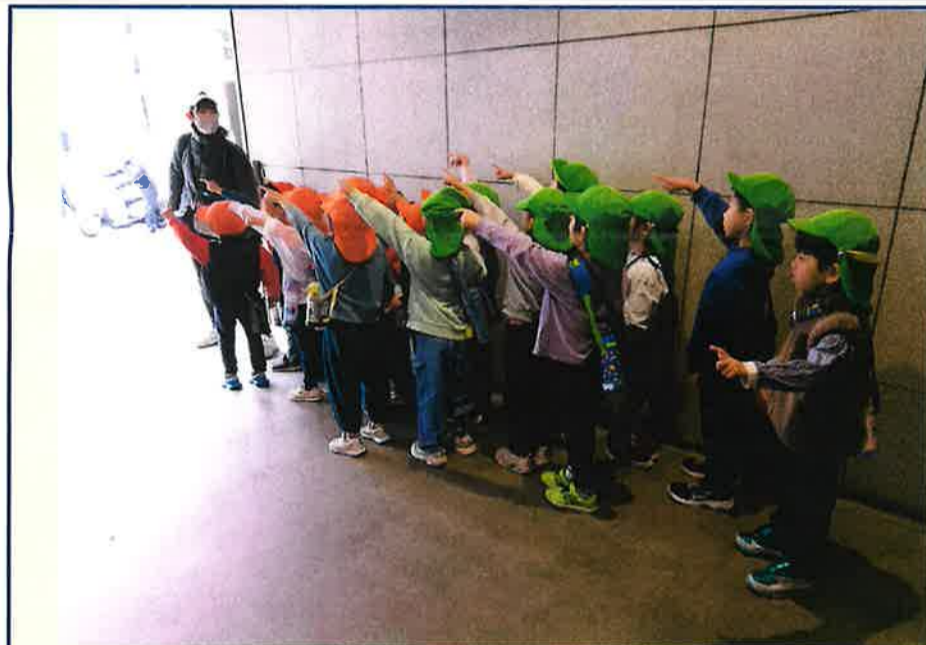
今日の天気を確認した後、散歩前に 「It's cloudy!」と教えてくれました。

また、雲の数を英語で話そうとする姿を見て、数字についての英語も知り、散歩後の人数を互いに英語で数えたり、どのように数えるのか相談しながら、全員の数を数えようとする姿も見られていました。