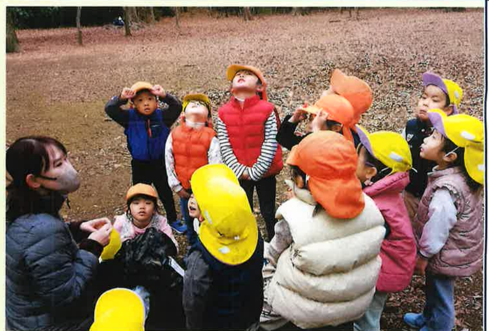
雲のことをCloudという事を知ると GrayのCloudがいっぱいあると話しています。