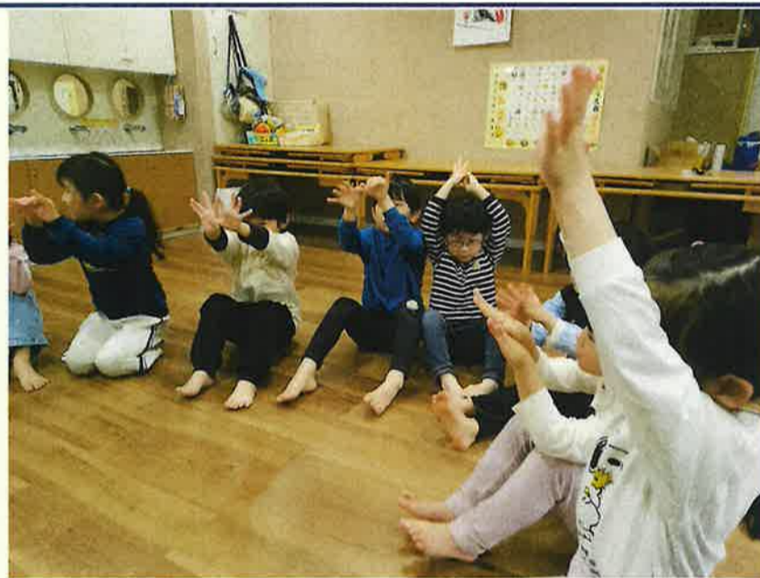
英語で手遊びに挑戦しました。 最後はチョウチョになり、羽ばたいています