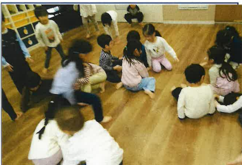
友達と単語あてゲームをしました どこを指すのか考えながら取り組みました