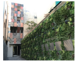
恵比寿ヒルズ外観